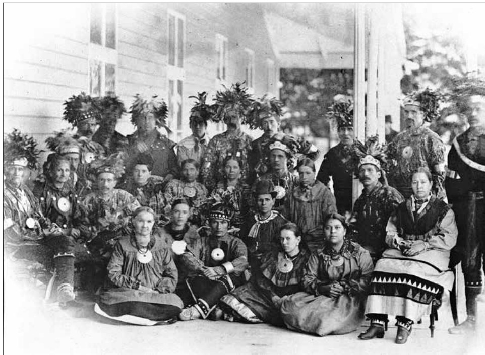
Slika 3: Wendatska skupnost v značilnih nošah [17]

so bila tako obširna, da je nek raziskovalec napisal, da se lažje izgubiš v njihovih poljih, kakor pa v gozdovih.