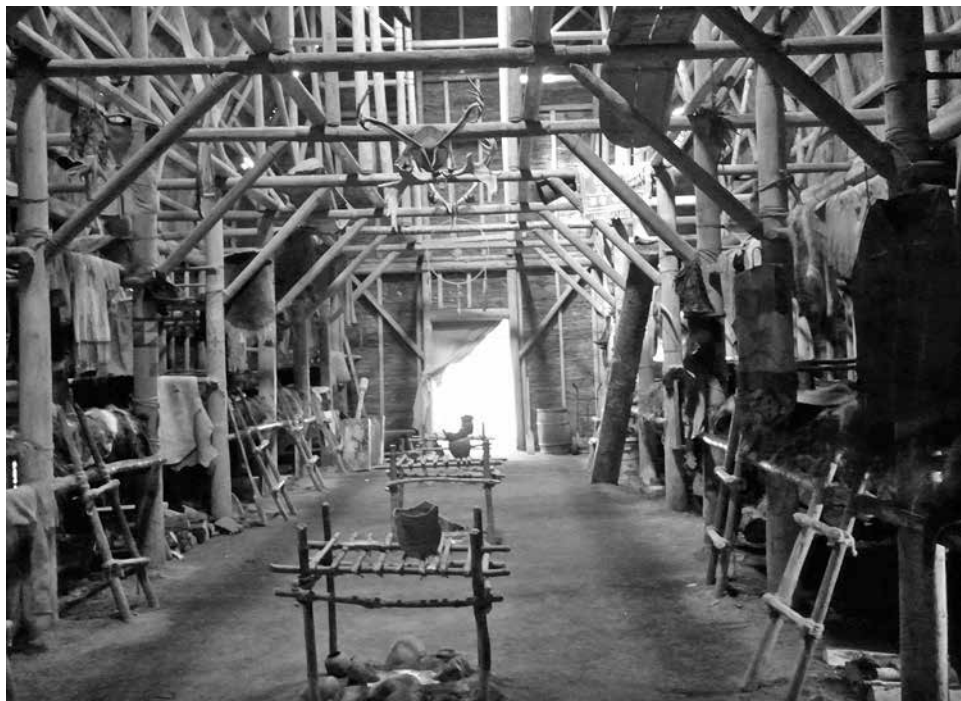
Slika 2: Vendatska notranjost dolge hiše kot rekonstrukcija v muzeju [15]

Živeli so v dolgih in visokih hišah, ki so bile značilne za njihovo evropsko domovino ob Baltiku – Venetskem zalivu; rekonstruirana notranjost take hiše je prikazana na sliki 2.