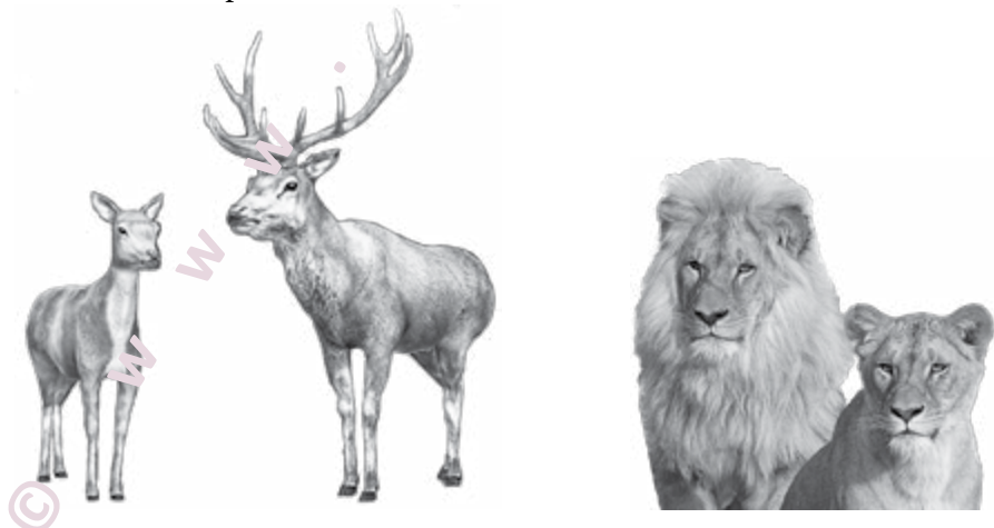
Slika 3: Samice že milijone let nagonsko izbirajo višje samce.

Ženske rade izbirajo visoke moške. S tem ni bilo pravzaprav nič narobe, dokler ... ni aneslo, da sem v grozi dojel izvor tega nagnjenja nežnega spola. Za tako izbiro v modernem svetu ni nobene razumske podlage, pač pa je zapisana v najglobjih koticah malih možganov. Če bi šlo za nagnjenje naših daljnih sorodnikov tam nekje v pragozdu, bi človek še razumel. Toda ne, gre za vzgibe zelo, zelo daljnih prednikov, ki so zemljo tlačili že več 10 milijonov let nazaj. In vse to še vedno igra odločilno vlogo pri samicah bitja homo sapiens. Gre za to, da samice nagonsko raje izbirajo večje pripadnike nasprotnega spola, ker »računajo« na to da bodo bolj uspešni pri preživljanju in obrambi njenega zaroda. Ali je mogoče, da človeška bitja vodi živalski avtopilot in ne razum?