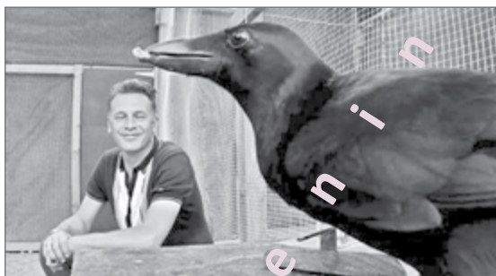
Slika 2: Primerjava inteligentnosti vran in ljudi.

Mnoge ljudi vodijo čustva, ne razum. Osebna razlaga prilagojena njihovemu miselnemu obzorju jim povzroča ugodje v možganih. Ali vsi ljudje uporabljajo razum? Nekateri ljudje razum uporabljajo le zato, da lažje vsilijo svoje miselno obzorje drugim. Pri tem jih ne vodi resnica, pač pa čista sebičnost, kar je popolnoma narobe. Tisti ljudje, ki so pošteni, delujejo tako, da je za njih sporna stvar sprejemljiva tudi v primeru, ko situacijo obrnemo okrog. Prevaranti pa ne dopuščajo nobenega obračanja situacije, saj si prizadevajo za sleparstvo in izkoriščanje drugih. Zavedajo se, da bi z obrnjeno situacijo izgubili vso prednost za katero so se gnali. S poštenjem ne bi ničesar pridobili.