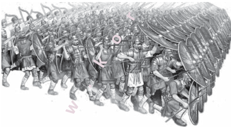
Slika 7: Rimsko cesarstvo je zmagovalo le zaradi inovativnosti, popolne enotnosti in izjemne organiziranosti.

Zakaj je potrebna enotnost, usklajenost? Kako v nasprotnem učinkovito doseči zmago? Ali bi bilo Rimsko cesarstvo mogoče vzpostaviti z »razštelano« vojsko v kateri vsakdo modruje po svoje, kako se je treba boriti? Ne le sebe, pač pa celotno skupino bi s svojo nespametjo spravil v težave.