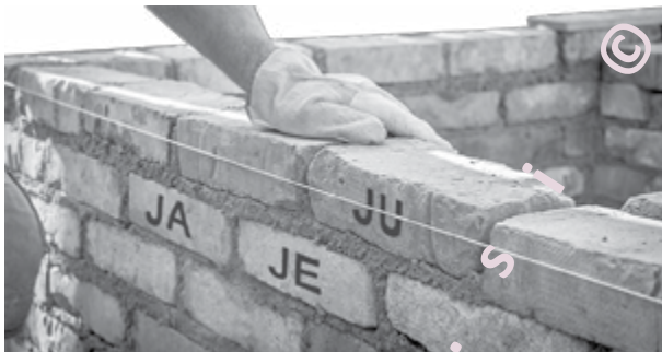
Slika 5: Dvoglasniki so osnovni elementi jezikovne zgradbe.