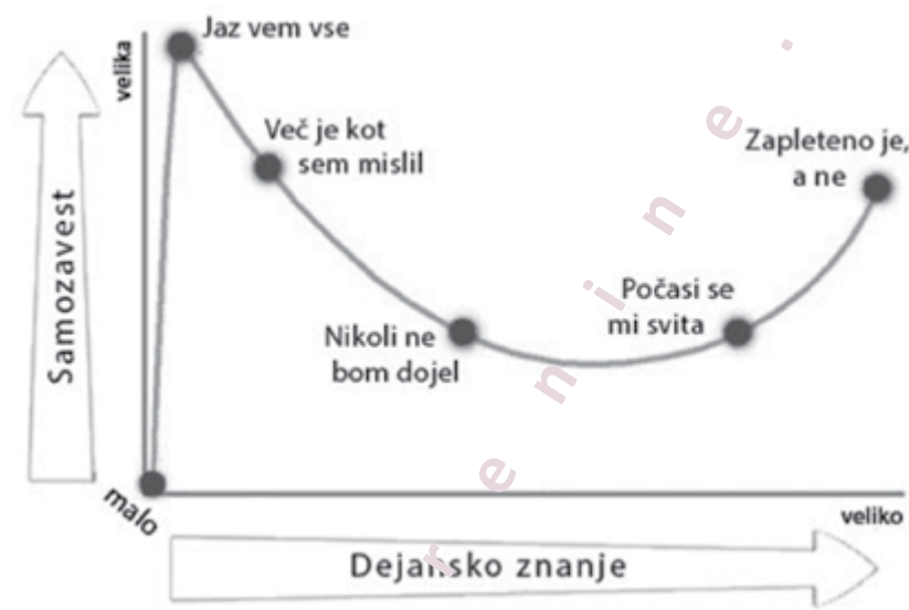
Graf 1: Korelacije med samozavestjo in vedenjem. Najbolj samozavestni so oni, ki ne znajo skoraj ničesar.

Dunning – Krugerjev efekt prikazuje izsledke raziskav človeške psihe, kot je prikazano na grafu spodaj. Tisti, ki vedo najmanj, so najbolj glasni, najbolj samozavestni in polni sami sebe. Žal je v človeški populaciji takšnih, ki se jim ni treba truditi, da bi kaj več vedeti, zelo veliko.