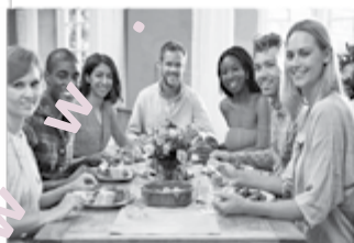
Slika 1: Nivo videnja in miselni procesi različnih ljudi.

Nekdo ki vidi le stvari po svojih »omejitvah« misli, da je to vse. Odbija tisto kar je nad njegovim dosegom (nivojem) ker se ne vklaplja v njihove predstave. Nič pa takim ljudem ne preprečuje, da ne bi imeli o tem mnenja. Zaradi različnega dožemanja oz. predstav o nečem, o istem dogodku ali stvari pogosto pride do krega.