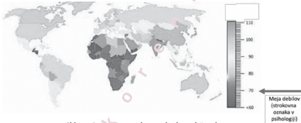
Slika 4: Povprečna inteligenca ljudi po državah sveta.